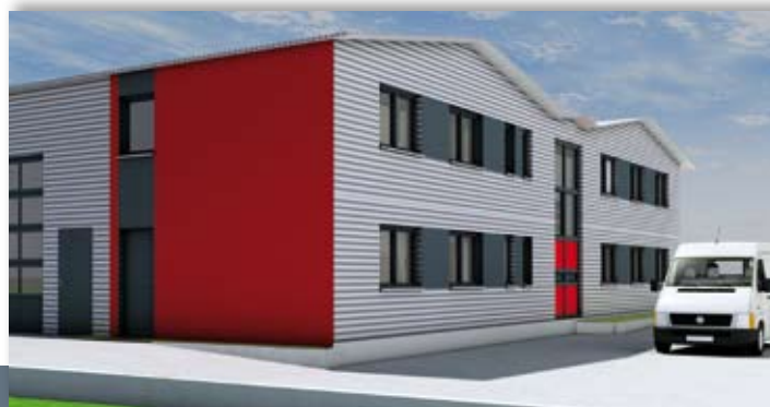
Ansicht hinterer Teil / Bürobereich

nen die Mieter zum Beispiel im Bürohaus Büroflächen ab 70 m 2 mieten oder ein Penthouse, in dem sie arbeiten und/oder wohnen.